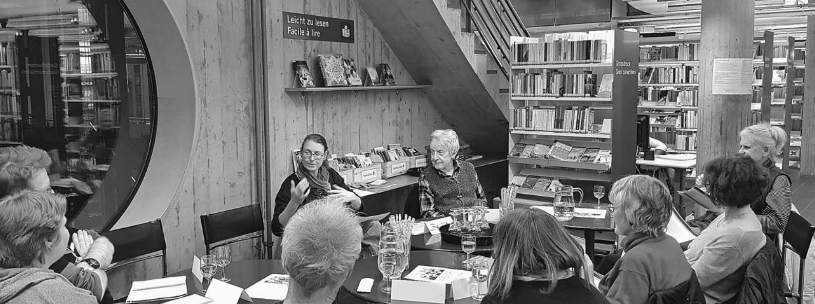
Shared reading. Soirée Lire ensemble.