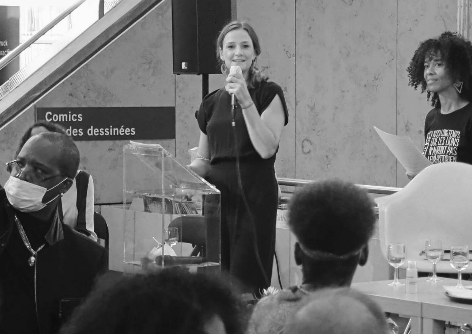
Vernissage du livre I will be different everytime , édition die brotsuppe

D'ailleurs, la presse jeunesse est une ressource précieuse pour répondre aux questions des enfants, même lorsqu'ils n'osent pas les formuler à voix haute.