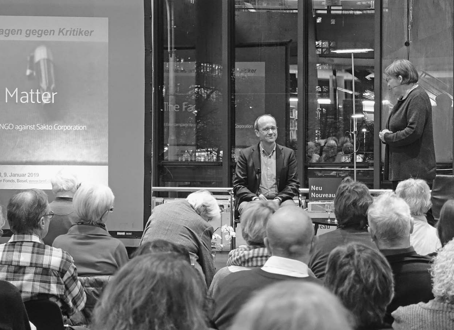
Conférence de Lukas Straumann « Contrer la critique par des fake news et des dépôts de plaintes »