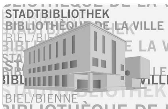
Nouveau visuel de la carte de membre.