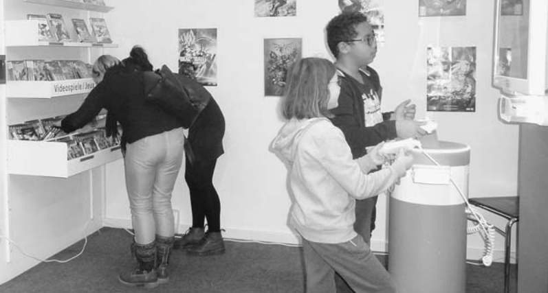
Inauguration jeux vidéo