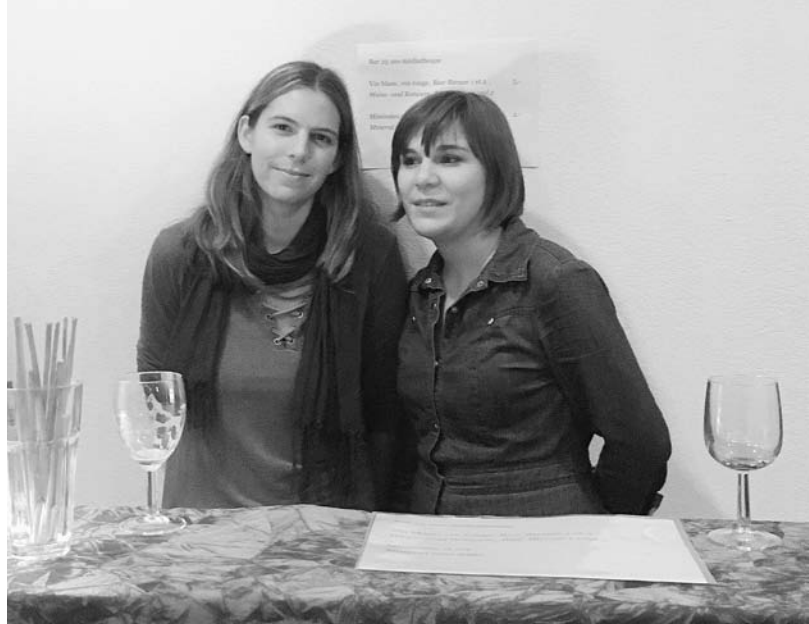
25 ans de la médiathèque

En raison des caprices de la météo de ces dernières années, nous avons testé un nouveau concept en 2016. Jusqu'à présent, notre bibliothèque de plage n'était ouverte que pendant les vacances d'été et desservie tous les jours de 14 à 19h00 par une bibliothécaire. Cette année, l'offre en livres et revues a été préparée dans des caisses dès le début de la saison. Pendant les vacances d'été, les bibliothécaires n'étaient plus régulièrement présentes. Nous avons remarqué que l'offre n'est ainsi pas prise en considération, resp. qu'elle encourage le public au vol et au vandalisme, contrairement à d'autres endroits, où ce principe fonctionne correctement. Le besoin de disposer d'une bibliothèque de plage est toujours présent. C'est pourquoi nous chercherons un nouveau mode de fonctionnement en 2017.